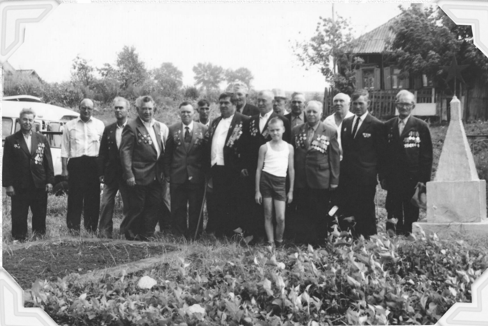
Митинг на памятнике в п. Ивне. Фото 1960-е гг.