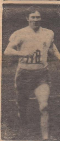
Редактор А. БАГРЯНЦЕВ