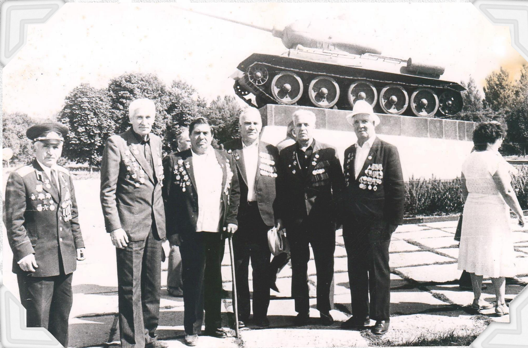
Ветераны Великой Отечественной войны на Мемориале «В честь героев Курской битвы». Фото 1973 г.